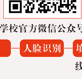
学校官方微信公众号

1.学生在来校报到前,请扫描下方二维码迎新系统或关注学校官方微信公众号登录江西新能源科技职业学院迎新系统,完成线上报到(操作步骤详见公众号2024级新生线上自助报到流程)。